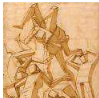
Luca Cambiaso - Studi di figure Firenze, Galleria degli Uffizi

dichiarasse la 'virtù' della classe dominante. Due sedi ospitano la mostra, Palazzo Ducale e i Musei di Strada Nuova - Palazzo Rosso: i circa duecento oggetti tra dipinti, disegni, sculture, arazzi e miniature, provengono da musei di tutto il mondo, fra cui le Gallerie fiorentine, la Pinacoteca di Brera di Milano, la Galleria Sabauda di Torino, il Polo Museale romano, il British Museum, il Louvre, l'Albertina di Vienna, la National Gallery di Edimburgo, il Blanton Museum di Austin, la Gemäldegalerie di Berlino, il New Orleans Museum of Art, il Princeton University Art Museum, il Museo del Prado, il Monastero Reale di San Lorenzo dell'Escorial. A Palazzo Ducale, lo spazio espositivo è articolato in una