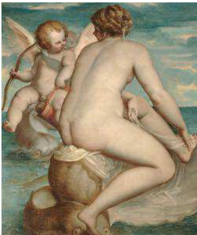
Luca Cambiaso - Venere e Amore sul mare - Roma, Galleria Borghese

Contemporaneamente al rivelarsi dell'attività dell'artista, Genova vive un momento di formidabile sviluppo del suo ruolo economico e politico, inserita in un circuito che lega i grandi centri del potere europeo. Cambiaso opera proprio in quel momento di eccezionale protagonismo della città, agli inizi della stagione nella quale l'aristocrazia genovese vuole e riesce a mostrare il ruolo internazionale raggiunto: lo testimoniano l'eccezionale sviluppo edilizio con la diffusione di una originale tipologia di ville e palazzi, recentemente riconosciuti dall'UNESCO con l'iscrizione nella Lista del Patrimonio Mondiale del sito "Genova: le Strade Nuove e il sistema dei Palazzi dei Rolli", e la coeva necessità di esprimere una grande decorazione che attraverso iconografie appropriate