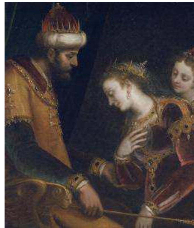
Luca Cambiaso - Esther e Assuero - Austin, Blanton Museum of Art

sequenza di sezioni che ripercorrono cronologicamente l'esperienza pittorica di Luca Cambiaso. A partire dal contesto degli anni Trenta del Cinquecento con la presenza dell'insegnamento dei grandi maestri, l'attenzione punta sempre più sullo specifico della vivace sperimentazione