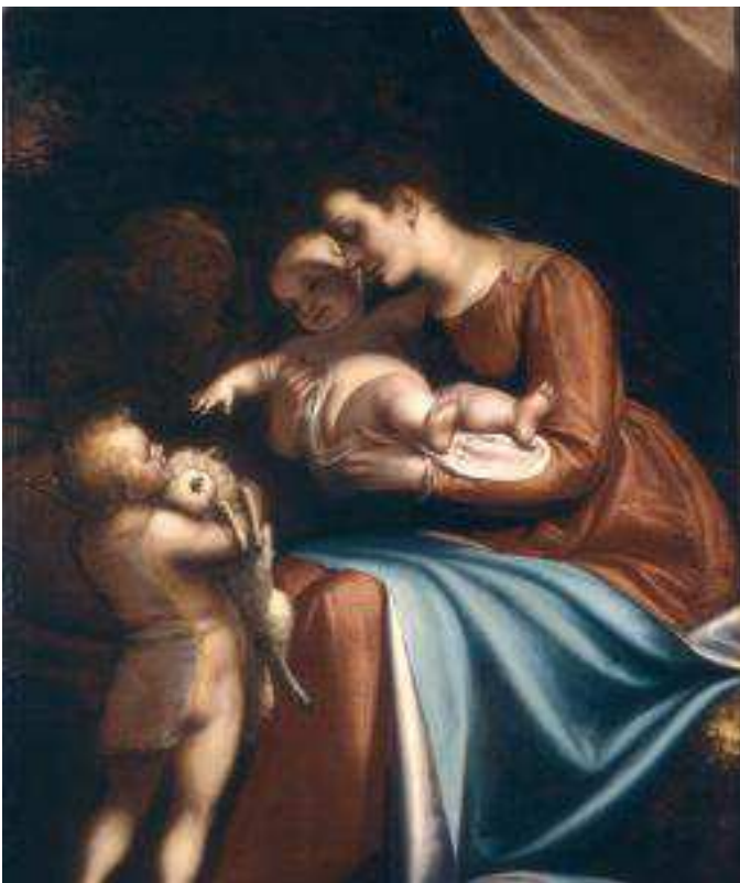
Luca Cambiaso - Sacra Famiglia con San Giovannino Edimburgo, National Gallery of Scotland

Luca Cambiaso, è senza dubbio l'artista ligure internazionalmente più noto, grazie alla complessità della sua esperienza artistica, alla sua qualità di disegnatore e soprattutto alla sua opera all'Escorial che ne conferma la notorietà nel panorama del tardo Cinquecento europeo. Il carattere di esemplarità del pittore ligure nel suo rapporto con i grandi maestri del Cinquecento e la sua dimensione europea, sono i presupposti di questa importante iniziativa espositiva che, a distanza di 50 anni dell'ultima mostra monografica, offre al pubblico una ampia selezione di opere che rivelano in modo completo le scelte del pittore e che permettono di seguirne l'itinerario artistico dall'esperienza giovanile fino all'attività per la corte spagnola.